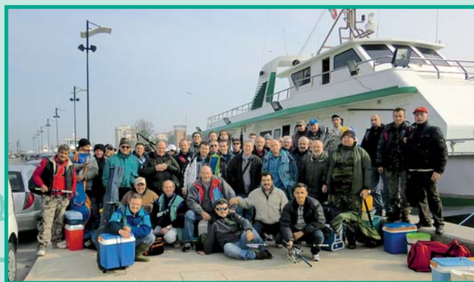
La squadra "Never Back Down" vincitrice di "Mundialito 2010"