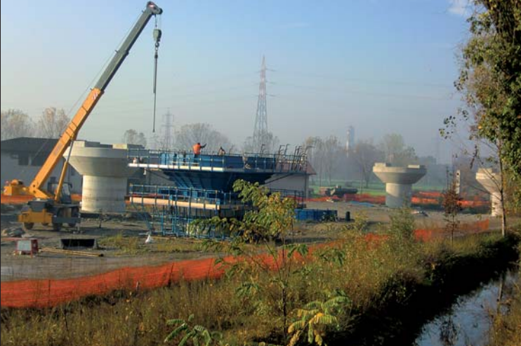
Proseguono alacremente i lavori della BreBeMi, sul tratto che passa dal nostro territorio

Proprio mentre scriviamo perviene la comunicazione da parte di Autoguidovie che, a partire da lunedì 22 novembre, in Corneliano Bertario transiterà la corsa della linea 35 che attenderà la corsa della linea Z407 in partenza da Gorgonzola alle 14,15. Una buona notizia che risolve il problema degli studenti di Corneliano Bertario.